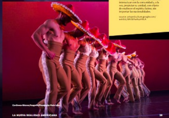
Conforme, Rivera, Fotografía: Photography Pablo Lobo

Y como una pequeña estrella, esta pequeña escuela fue reconocida hasta convertirse en la compañía de danza que es hoy: una compañía reconocida y aplaudida a nivel nacional e internacional. Además, el Ballet Hispanico tiene sus departamentos, así como una escuela, para establecer una conexión con la comunidad y especialmente, por ser un canal de inspiración y apoyo para niños y jóvenes. Definitivamente, el Ballet Hispanico es un ejemplo maravilloso de que ningún sueño es tan grande para ser inalcanzable; sólo se necesita mostrar una estrella, una idea, un sueño, y trabajar duro para verlos crecer y florecer.