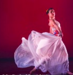
Conforme, Rivera, Fotografía: Photography Pablo Lobo