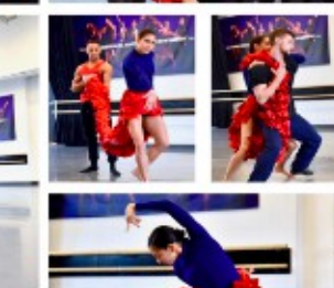
THE NEW AMERICAN REALITY