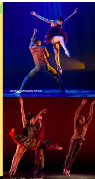
THE NEW AMERICAN REALITY